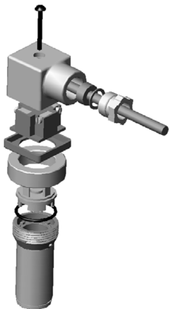
Figura 1 - Dessin explosé du connecteur